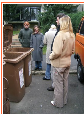
Ilustrace 9: MNO - exkurze sběr bioodpadů