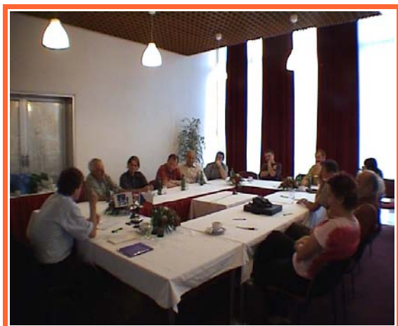
Ilustrace 6: Výzkum - vnímání ekocenter v Úst. kraji

Koordinaci, administraci a finanční řízení projektu zajišťuje odbor evropských projektů Krajského úřadu Ústeckého kraje, který je v gesci Ing. Petra Fialy, náměstka hejtmána Ústeckého kraje. Partneři projektu jsou: Český svaz ochránců přírody 4. ZO Tilia Krásná Lípa, Středisko ekologické výchovy a etiky Rýchory SEVER – Brontosaurus Krkonoše, Podkrušnohorský zoopark Chomutov, Fakulta životního prostředí Univerzity Jana Evangelisty Purkyně v Ústí nad Labem a Střední škola EDUCHEM, a.s., se sídlem v Meziboří.