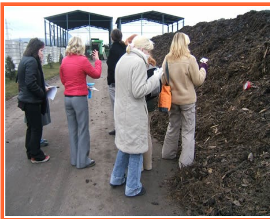
Ilustrace 10: MNO- exkurze na kompostárnu Pitterling