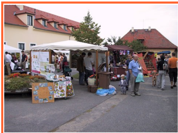
Ilustrace 1: Infostan Toulcův Dvůr