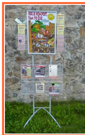
Ilustrace 7: Stojan ISE