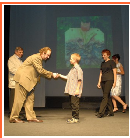
Ilustrace 3: Výherce soutěže Nejlepší dílo o kompostu

Součástí galavečera byl první ročník módní přehlídky „ Nulový odpad 2006 “, kde se sešly jedinečné modely od mladých tvůrců, které byly zpracované z odpadových materiálů, biodegradabilních plastů, ze starých, přešivaných oděvů a mnoha dalších materiálů. Přehlídku podpořila Helena Fejková částí své Iněné kolekce,