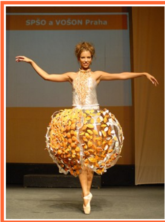
Ilustrace 5: Přehlídka Nulový odpad 2006