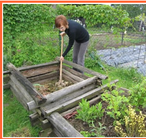
Ilustrace 4: Vítězný kompost