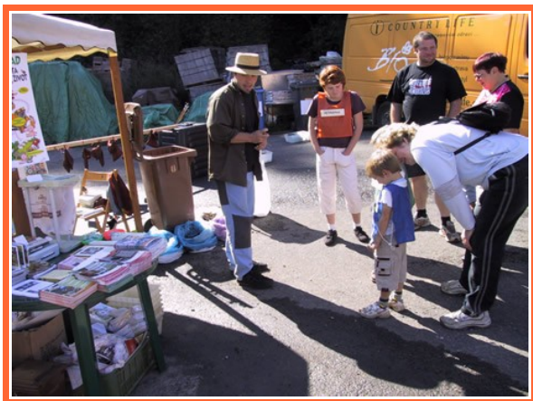
Ilustrace 2: Infostan Nenačovice