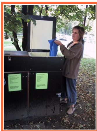
Ilustrace 11: Komunitní kompostování v Chrudimi

Komunitní kompostování představuje jednoduchý a levný způsob využívání bioodpadů. Je mezistupněm mezi domácím a komunálním kompostováním a umožňuje lidem, kteří nemají vlastní zahradu, využívat v blízkosti místa bydliště vlastní bioodpady. V rámci pilotního ročníku projektu byla ověřena možnost komunitního kompostování v panelovém sídlišti U Stadionu v Chrudimi, kde byl instalován kompostovací box, do kterého své bioodpady v roce 2006 ukládalo cca 20 rodin. Box je uzamykatelný, má perforované dno pro odvod zbytkové vody a lepší provětrávání. Pro minimalizaci změn teplot je box opatřený tepelnou izolací, má uzamykatelné čelní dveře a víko, aby nedošlo k znečištění kompostu nežádoucími příměsími či k vniknutí hlodavců. Klíč od kompostéru obdrží každý, kdo se chce zapojit do kompostování. Pilotní ročník projektu probíhal díky ekocentru PALETA, které získalo finanční prostředky od města Chrudim.