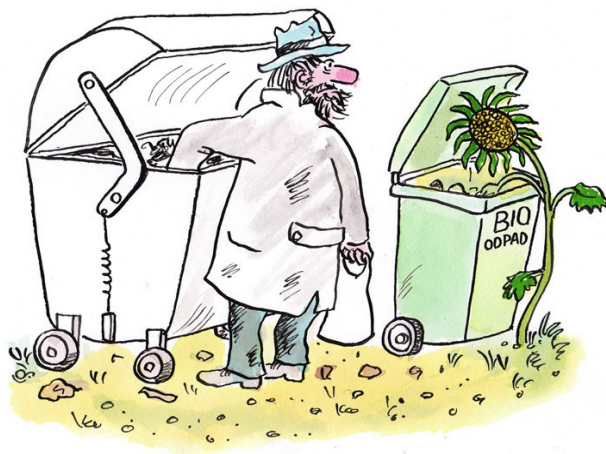
Ilustrace 12: Jaroslav Dostál (ČUK – soutěž na téma MISS KOMPOST)

Tisk vybraných záznamů: Datum >= 01.01.2006, Datum <= 31.12.2006